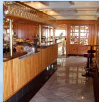
Mitschiffs: die Bar.