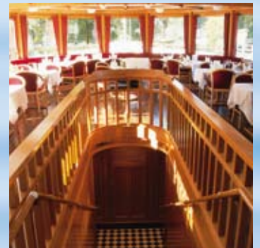
Der komfortable Bugsalon.