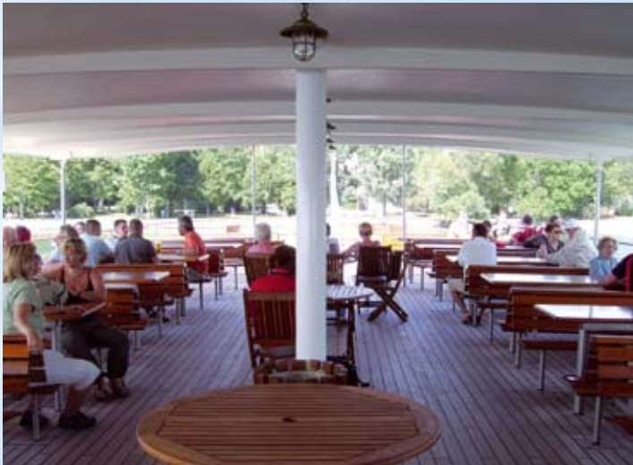
Das überdachte Freideck bietet viel Platz zum Entspannen.