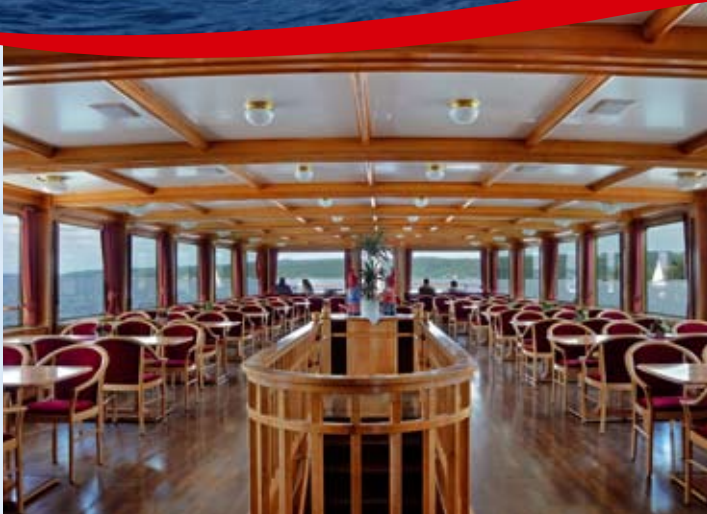
Stilvolles Ambiente im Hecksalon.