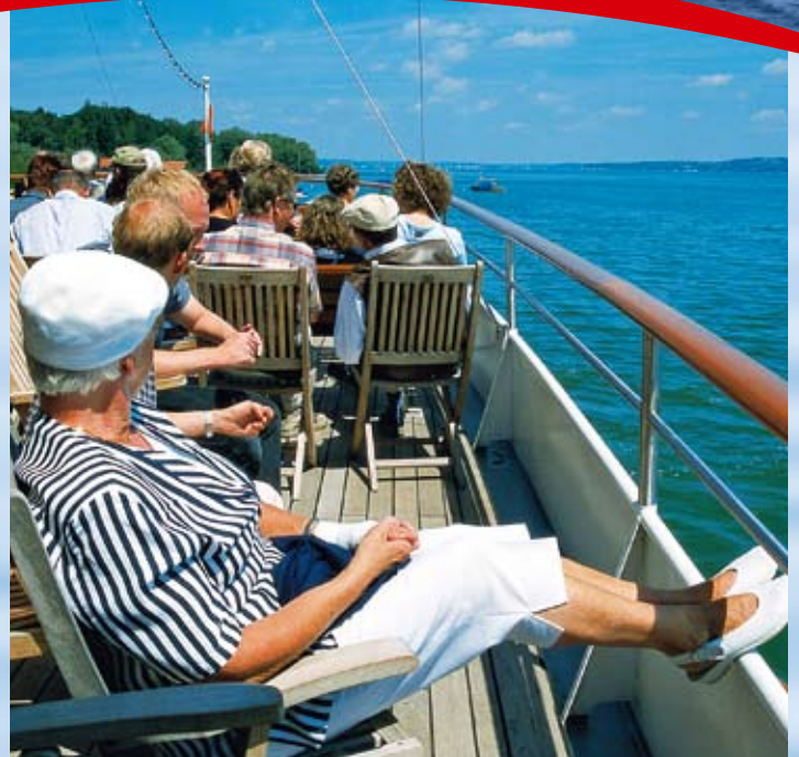
Wasser, Luft und Sonne genießen.