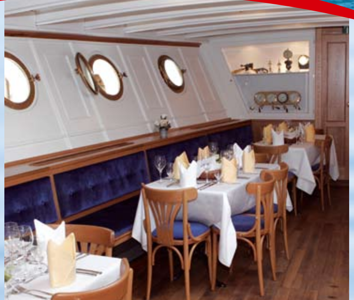
Salonfähig: der elegante Bugsalon.