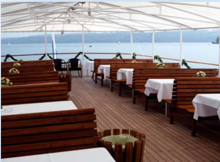
Das geräumige Freideck.