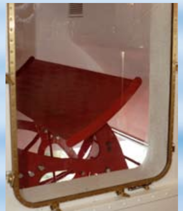
Blick auf das Schaufelrad.