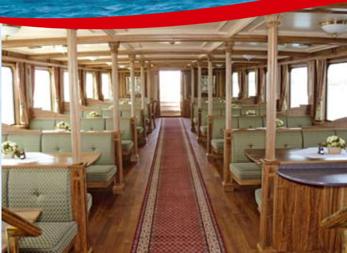
Der prachtvolle Hecksalon.