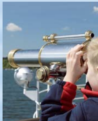
Mit dem Fernrohr das Ufer erkunden.